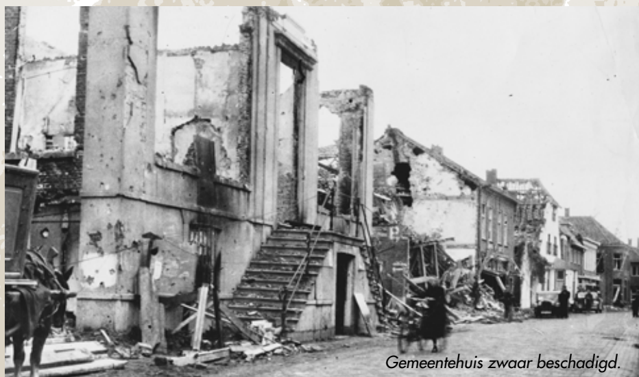
Gemeentehuis zwaar beschadigd.

Doch nogmaals moesten wij het ontgelden, want circa 12 uur klinken boven het geraas der passerende tanks enkele granaatinslagen. De Duitsers bliezen den aftocht door enkele schoten op het fel omstreden Schijndel af te vuren en weer vielen er doodden op deze jubeldag, die daarnaast ook de laatste granaat over en in ons dorp bracht.