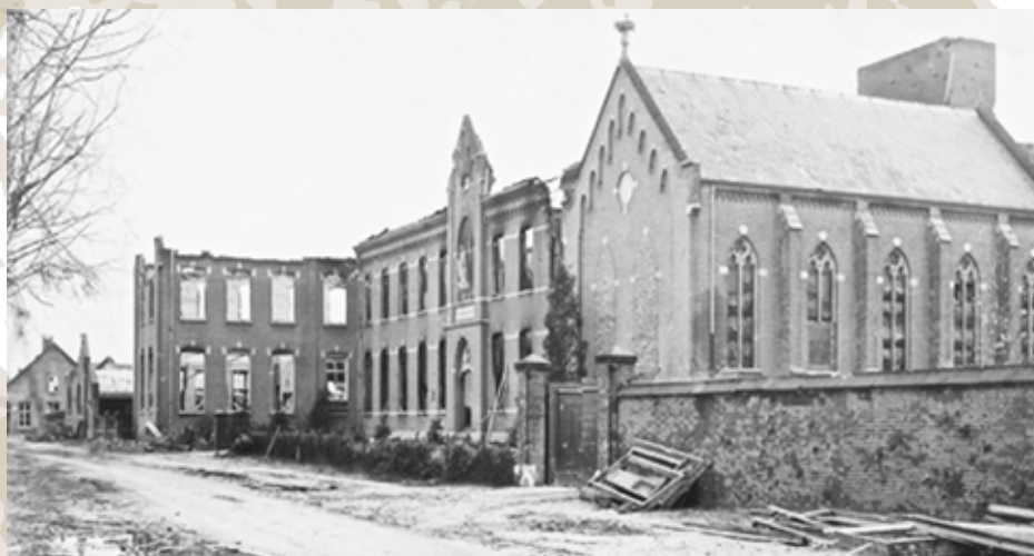
"Moederhuis" zwaar beschadigt.

bij deze familie een gastvrij onderkomen. Enige tijd later stopte op het erf een auto waaruit twee Duitsers stapten. Een van de onderduikers zat juist aan tafel omdat er gegeten moest worden. Hij kon echter niet meer wegkomen en werd gevangen genomen.