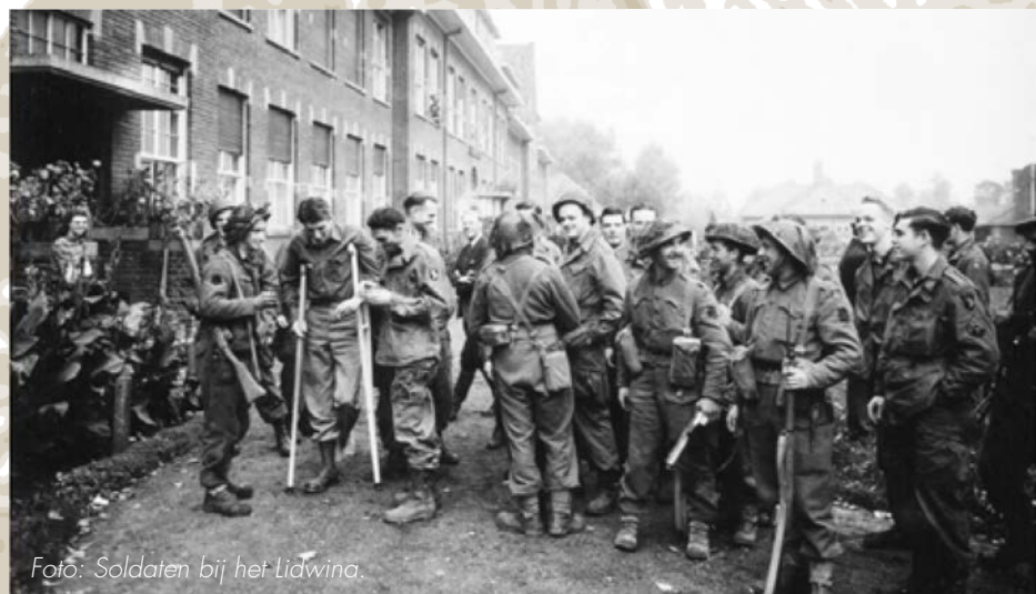
Foto: Soldaten bij het Lidwina.

"18 Sept. Vroeg in den namiddag bood de lucht ons hetzelfde schouwspel. Vliegmaachines bij honderden, waarvan de meeste aan een stevige kabel ook nog een zweeftoestel meevoerden, die naar we later van inzittenden vernamen, elk nog 5 à 6 piloten bevatten. En .... bovendien een opvouwbaar kleine auto, waarmee heel wat Amerikanen uit de "gliders" (zoo worden de zweefvliegtuigen genoemd) zich bij een eventuele val bliksemsnel uit de voeten maken, voordat grijpgrage Duitse handen op het toneel verschijnen om hen in te rekenen. Zeven Amerikanen waren echter niet zo ge-lukkig, dat ze dit kunststuk konden volbrengen. Een werd al in den namiddag als dode hier binnengebracht, tegelijk met een Duitser, die als eerste slachtoffer op straat was gevallen. Broederlijk lag de robuuste, grote Canadees naast den schrielle, Kleine Duitser in onze lijkkamer: broederlijk werden ze ook in eenzelfde dubbel-lang graf op het Bosschwegse kerkhof te ruste gelegd. De volgende dag bracht men er nog twee bij. Tegen den avond brachten 5 Duitsers, geholpen door heren en dames van de E.H.B.O. 6 gewonde Amerikanen als "krijgsgevangenen" in ons ziekenhuis. Een ervan had beide benen gebroken. Twee Duitsers bleven hier om de gevangenen te bewaken".