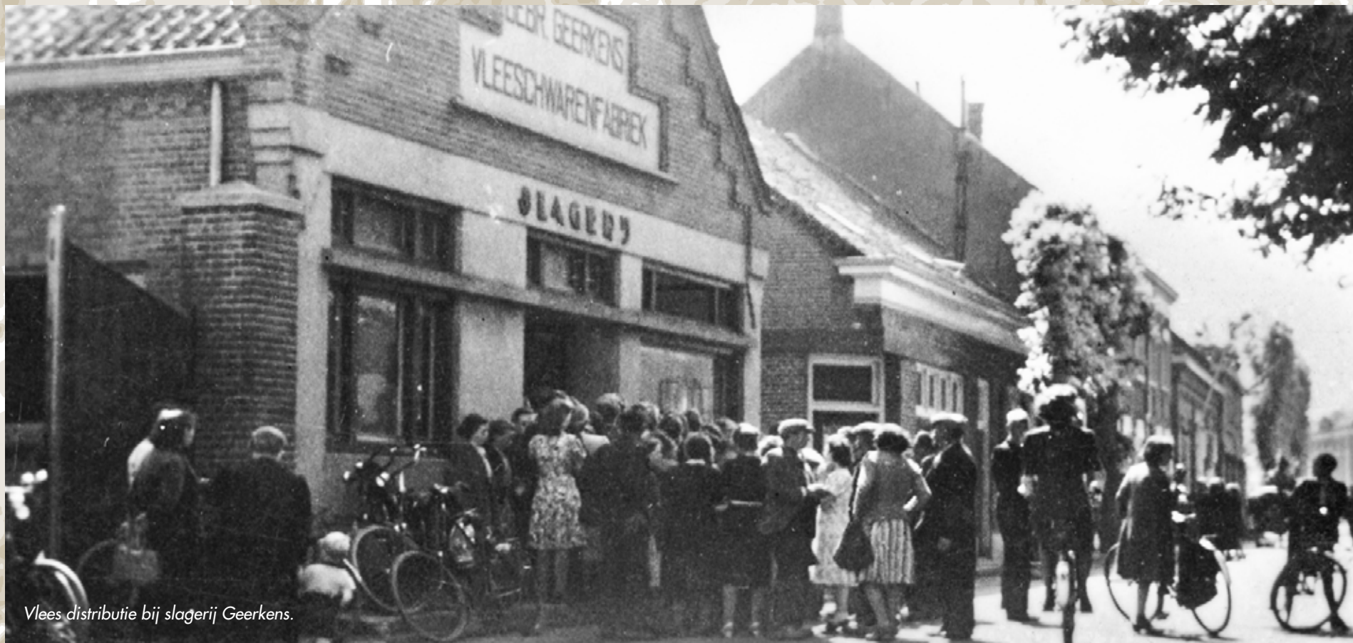
Vlees distributie bij slagerij Geerkens.

Voor de laatste twee maanden van de gruwelijke oorlog leefde de hele gemeenschap van Schijndel onder de grond. Doordat velen huis en haard hadden moeten verlaten waren er enkele grotere concentraties van evacués en de overige verbleven in de eigen gemetselde kelders of hadden buiten in de tuin een grote kuil gegraven en deze afgedekt met hout, stro en zand. In de kelders van het Moederhuis vonden ruim 950 mensen onderdak, in de kelders van slagerij Geerkens bijna 400 en bij St. Lidwina bijna 700. Ook de kelders van het boterfabriek en de bierkelders bij de familie Swinkels waren propvol, evenals de wat grotere kelders bij diverse particulieren. Voor zover men nog in staat was om zelf het eten klaar te maken.